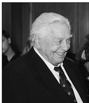
1 Ю.П. Любимов