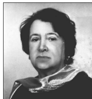
6 Н.И. Сац

5 Возглавлял единственный в мире Театр зверей.