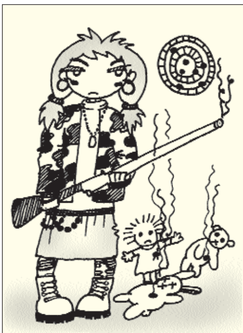
Рисунок Кристины Звездинской

Позитивное воздействие: использовать все благоприятные ситуации и моменты для обучения ребенка; всегда хвалить за успехи; воспринимать его таким, каков он есть на самом деле; требовать от него ответственного поведения; помогать в преодолении трудностей; поправлять его, если он что-то сделал не так; показывать ему, что можно делать, вместо того, чтобы указывать, чего делать нельзя; делать за ребенка то, чего он сам сделать пока не в состоянии; поощрять инициативу ребенка в ситуациях, с которыми он сам может справиться, и оберегать его от ситуаций, с которыми он справиться не в состоянии; поощрять его самостоятельность и творчество.